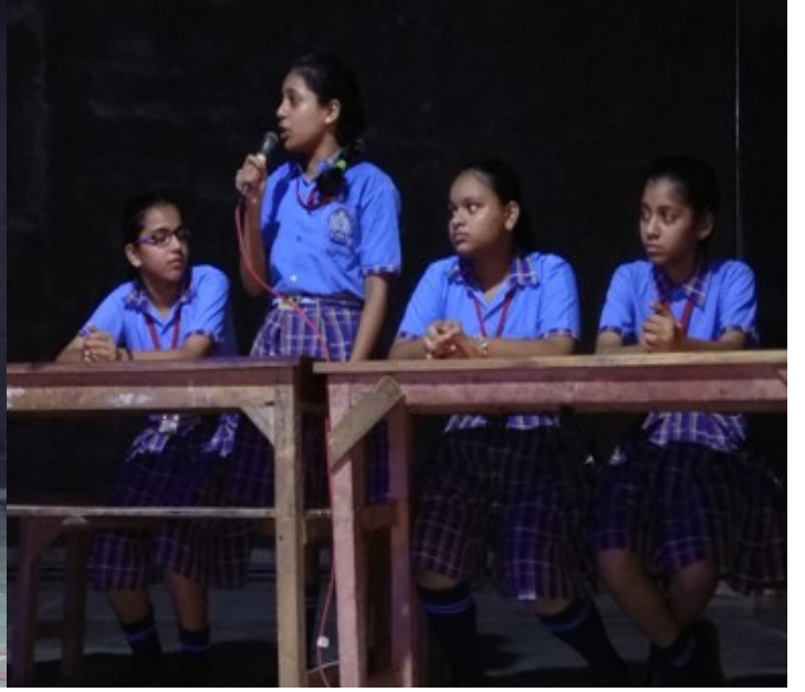
नाट्य - मंचन